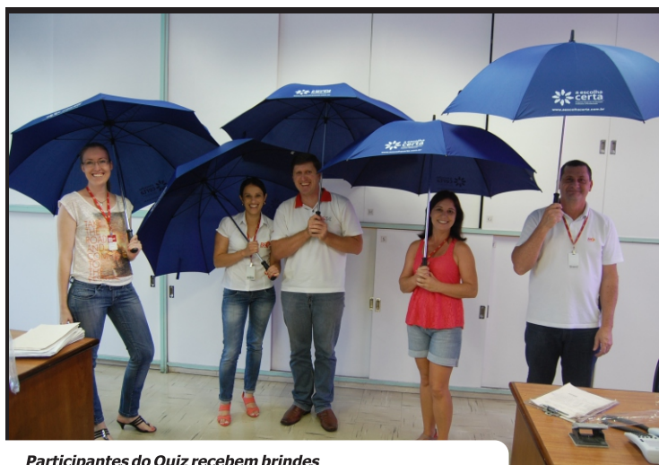
Participantes do Quiz recebem brindes