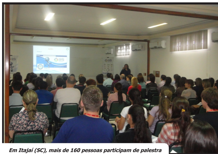
Em Itajaí (SC), mais de 160 pessoas participam de palestra