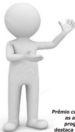
Prêmio consolida as ações do programa e destaca a BFPP

O programa conta uma série de ações, entre elas um "Quiz" que envolveu mais de 700 participantes de vários fundos de pensão. Da BFPP 37 participantes foram premiados com 1 Tablet e 36 guarda-chuvas personalizado. Também, foi realizada palestra em Itajaí envolvendo 164 participantes com foco em planejamento de orçamento pessoal, além de vídeos, apostilas e histórias em quadrinho publicadas no "site": www.aescolhacerta.com.br/bfpp .