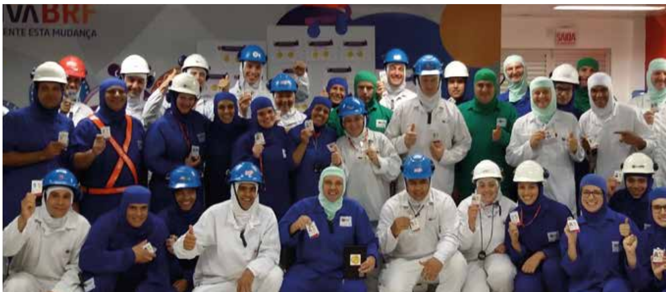
Funcionários da BRF exibem crachá em atividade realizada na empresa

Estamos entre os maiores fundos de pensão do país