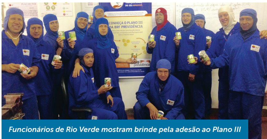
Funcionários de Rio Verde mostram brinde pela adesão ao Plano III

Em setembro promovemos Palestras e participamos de eventos sobre previdência em unidades como: Carambeí, Francisco Beltrão, Chapecó, Marau e Tatuí. Neste mês foi a vez de Rio Verde e Mineiros receber nossos representantes.