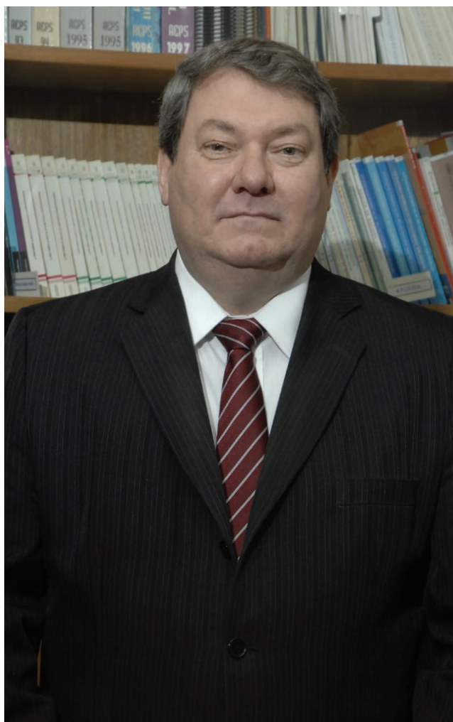
Professor debate Previdência Privada

Segundo o professor, a grande vantagem da previdência complementar é que se trata de uma poupança, porém, com valor superior ao tradicional investimento, já que a empresa também contribui com a contrapartida mensal no mesmo valor. “O ideal é que todos valorizem este benefício a partir do instante em que se ingressa na empresa. Apenas por contribuir com o plano a partir deste momento, já está sendo garantido uma vantagem de uma renda extra ao