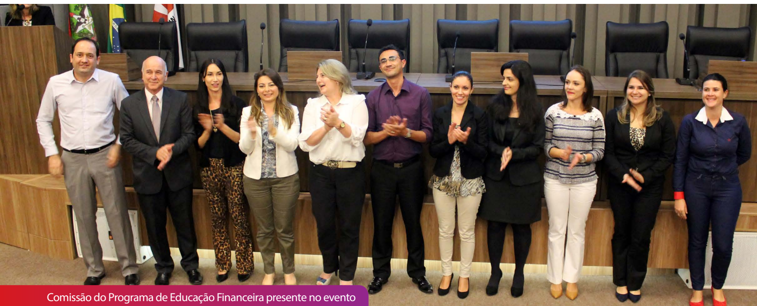
Comissão do Programa de Educação Financeira presente no evento

O conteúdo do Programa inclui um site exclusivo ( www.aescolhacerta.com.br ), perfil no Facebook, aulas, vídeos, revistas e tiras em quadrinhos que apresentam uma família às voltas com desafios financeiros.