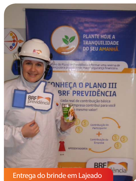
Entrega do brinde em Lajeado

Para saber mais sobre a Campanha e as próximas ações, acesse o site www.brfprevidencia.com.br . Fique atento também às informações disponibilizadas em sua unidade ou procure a área de Gente para ficar por dentro das atividades e convencer os seus colegas a também aderirem ao Plano.