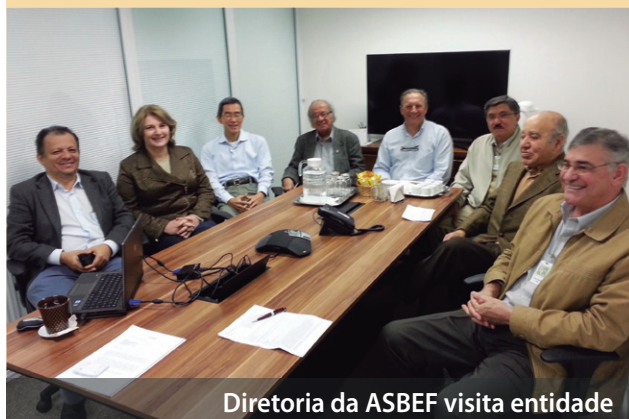
Diretoria da ASBEF visita entidade

A alteração valerá a partir de janeiro de 2015.