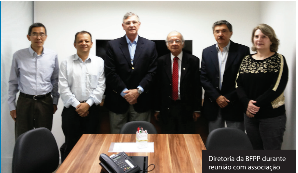
Diretoria da BFPP durante reunião com associação

Comunicaremos prontamente aos participantes tão logo tivermos uma definição apresentada pela Previc.